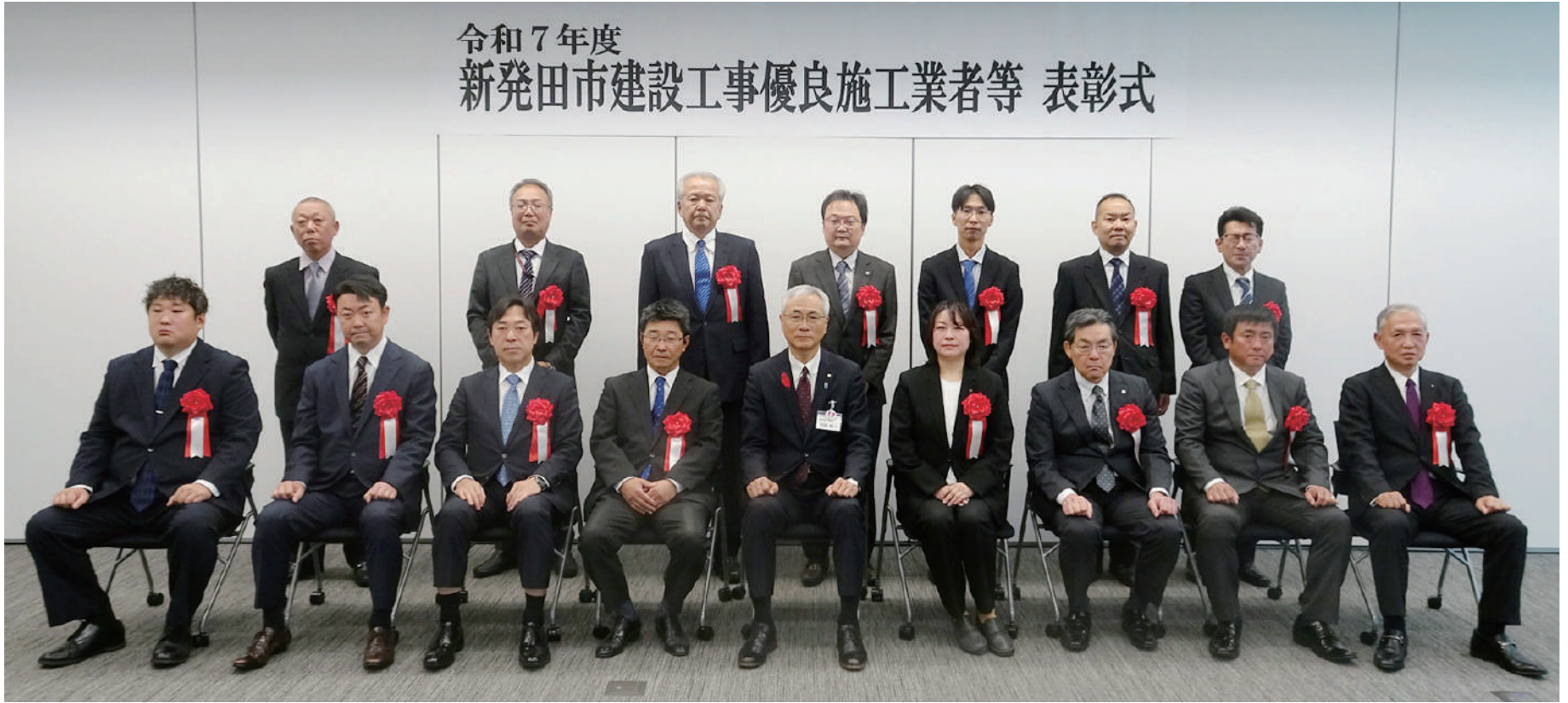
伊藤副市長と受賞者が一緒に記念撮影